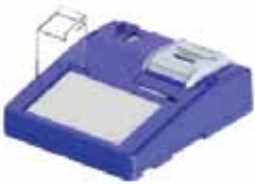
Kits de Identificación Biométrica