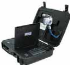
Kits de Registro Biométrico