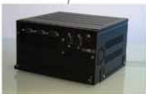
ORDENADOR DE MISIÓN